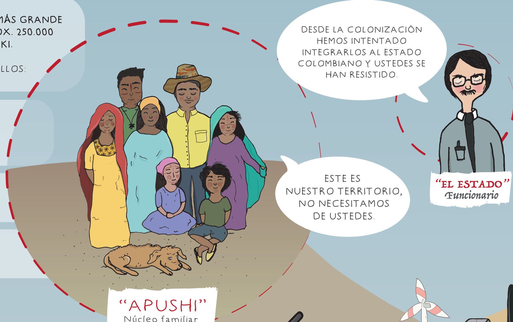
"APUSHI" Núcleo familiar